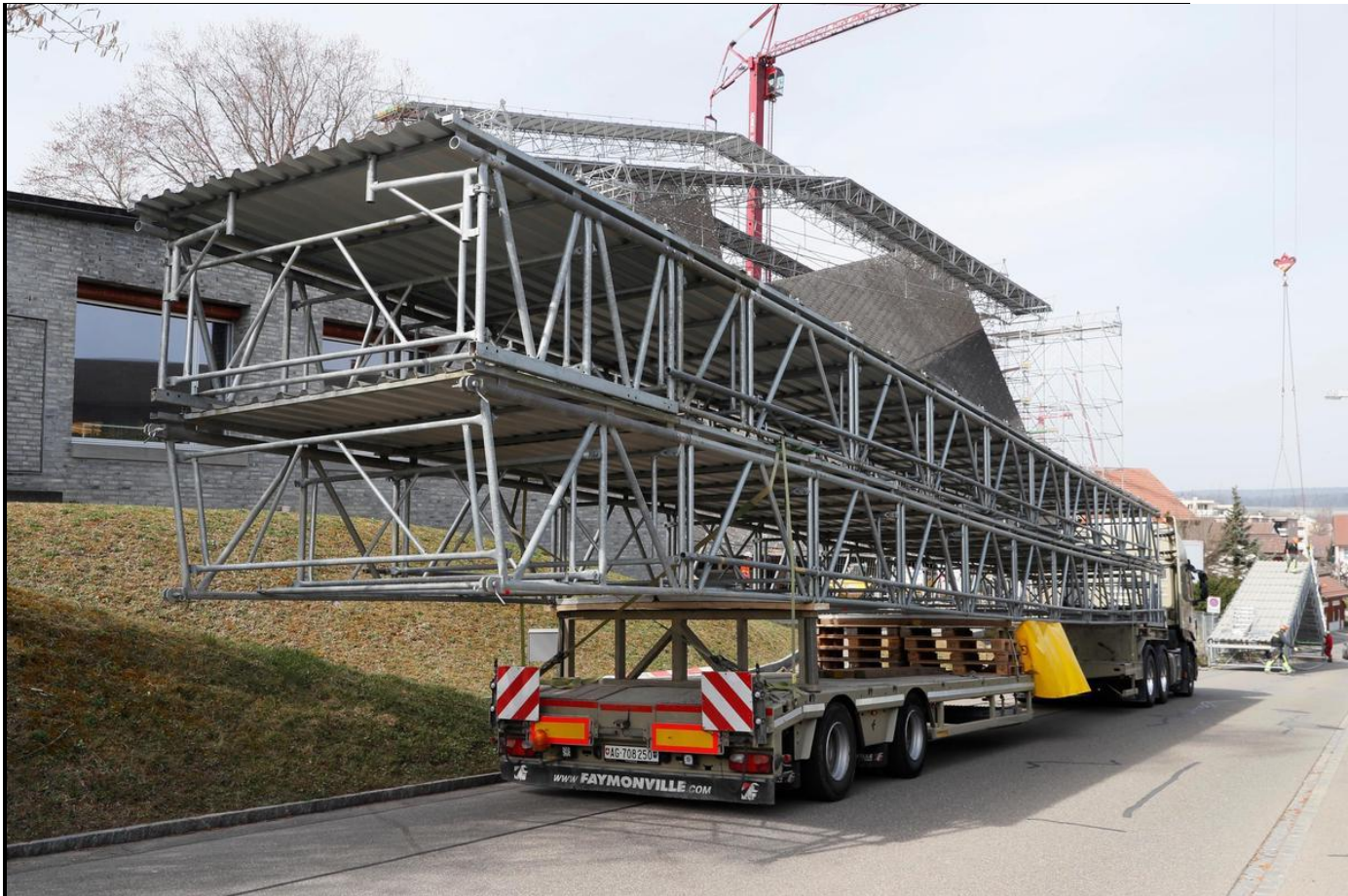
Die riesigen Elemente kamen per Tieflader.